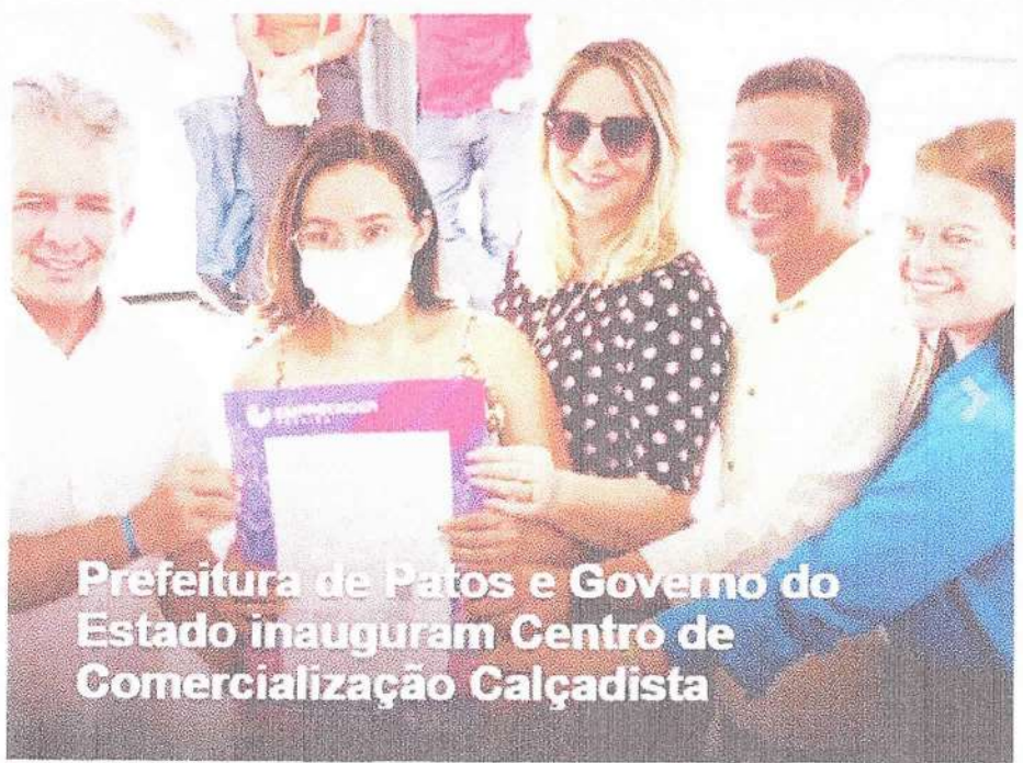
Prefeitura de Patos e Governo do Estado inauguram Centro de Comercialização Calçadista