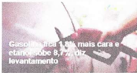
Gasolina fica 1,8% mais cara e etanol sobe 8,7%, diz levantamento