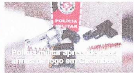
Polícia militar apreende mais de duas toneladas de drogas em Cacambas