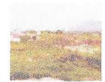
NA PARAIBA Chove em vários municípios da PB nas últimas 24h