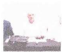
NO SERTÃO Jornais de guerra relembram desafios do povo