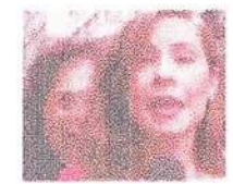
NO AR Polêmica do ministro da Saúde em live é mais reportar