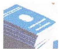
POSITIVO Faltam 20 milhões para o Brasil atingir o emprego em 2024