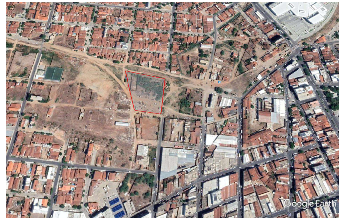
LOCALIZAÇÃO DA ÁREA A SER DESAPROPRIADA NO MAPA GOOGLE

ESTADO DA PARAÍBA PREFEITURA MUNICIPAL DE PATOS GABINETE DO PREFEITO