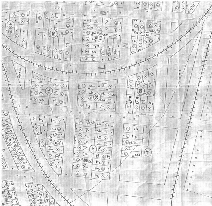
LOTEAMENTO DR. PEDRO FIRMINO