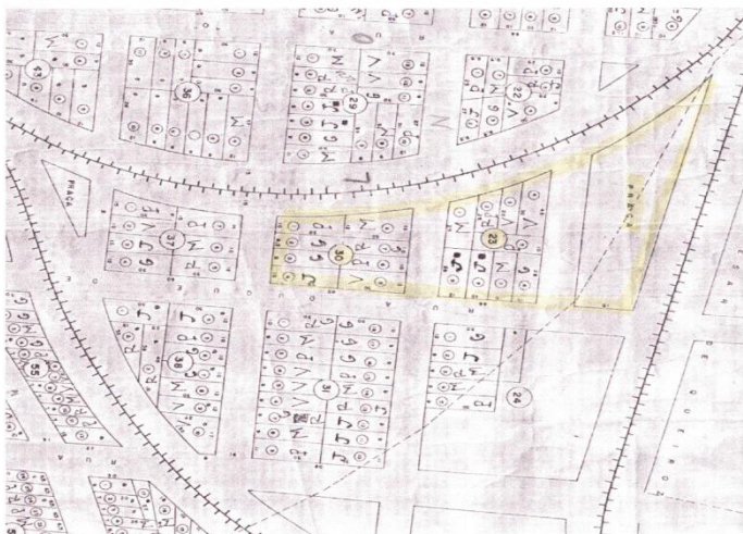
Loteamento Dr. Pedro Firmino