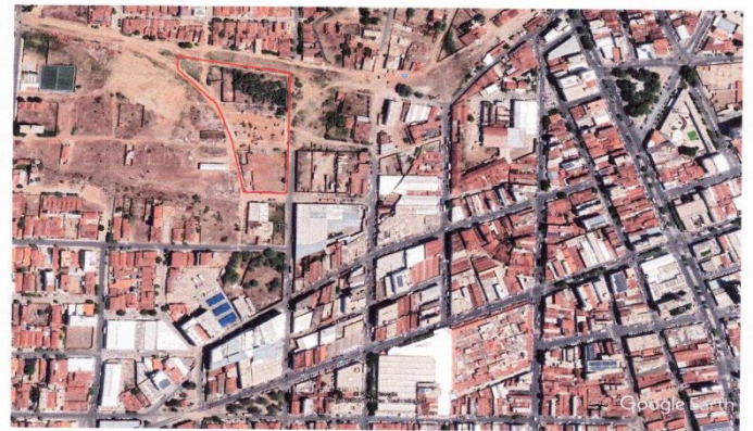
Localização das Quadra desapropriadas no Mapa Google

ESTADO DA PARAÍBA PREFEITURA MUNICIPAL DE PATOS GABINETE DO PREFEITO